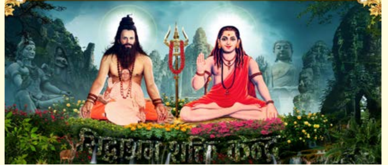
परमपूज्य सद्गुरुदेव परमहंस स्वामी श्री निखिलेश्वरानन्द महाराज